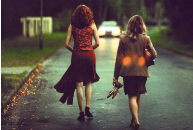
Filmbild aus „Lichter“, 2003