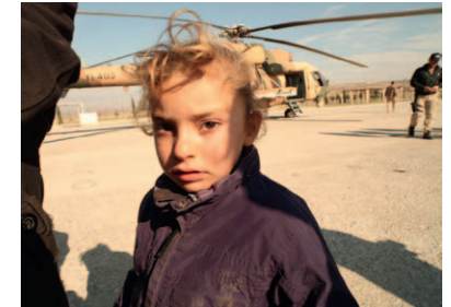
Filmbild aus „Háwar - Meine Reise in den Genozid“, 2014