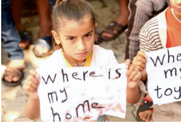
Filmbild aus „Háwar – Meine Reise in den Genozid“, 2014

Das Zusammenleben der Kulturen in Deutschland und der Welt an und mit Grenzen ist das Thema der diesjährigen Potsdamer Gespräche. Aus historischer Perspektive nähern sich die Mitglieder des Forums Neuer Markt dem Leben an der Grenze, den möglichen Schwierigkeiten religiöser und kultureller Vielfalt sowie dem Kampf um die Sprengung politischer Grenzen, aber auch dem Verlust der Heimat und dem Neuanfang in einer möglichen neuen Vielfalt.