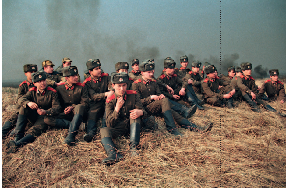
Abzug der sowjetischen Armee aus Krampnitz, 1991